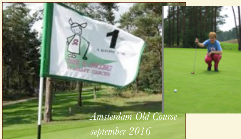
Amsterdam Old Course september 2016